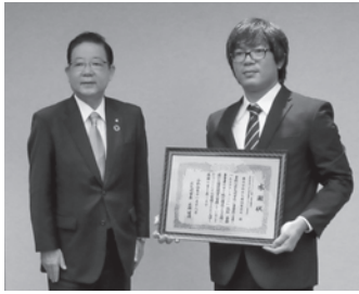
株式会社北九樹脂製作所 NC 金型課