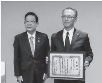
太陽インダストリー株式会社